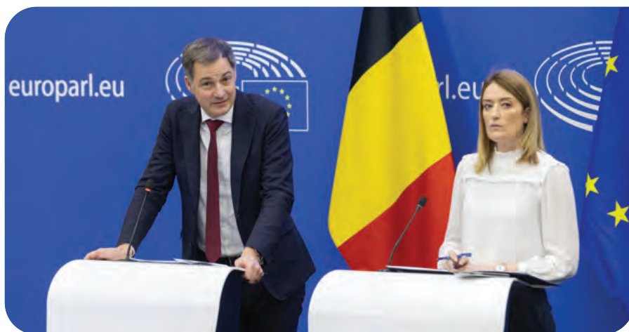
Le Premier ministre Alexander De Croo et la Présidente du Parlement européen Roberta Metsola lors de la conférence de presse sur la présidence belge du Conseil des ministres l'UE.

La CGSLB a beaucoup d'attentes concernant la mise en œuvre du programme de la présidence belge. Celui-ci constitue une opportunité de pousser la législation européenne vers une plus grande solidarité en faveur des travailleurs. Articulés autour de six thématiques, les objectifs belges couvrent l'ensemble de la politique européenne tels que la défense de la démocratie, le renforcement du programme social européen ou encore la