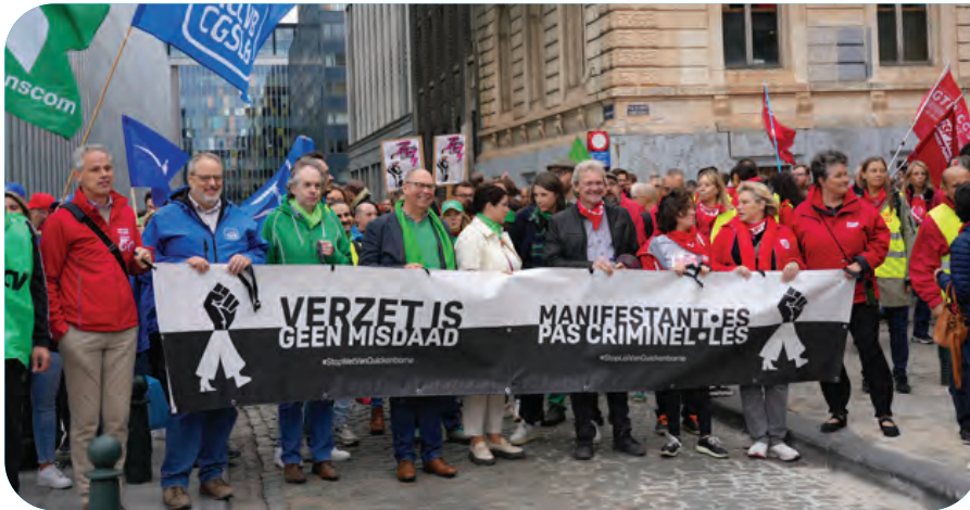
10 000 personnes s'étaient mobilisées à Bruxelles le 5 octobre pour dire non à ce projet de loi.

Les syndicats et organisations de la société civile s'y sont opposés pendant près de six mois, que ce soit par des actions, des manifestations, des interpellations de représentants politiques. La mobilisation a fini par payer, l'interdiction judiciaire de manifester est abandonnée !